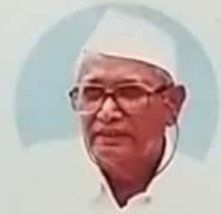
डॉ. बाळासाहेब विखे पाटील (पद्मभूषण उपाधिने सन्मानित) (१९३२-२०१६)