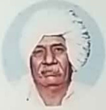
डॉ. विठ्ठलराव विखे पाटील (पद्मश्री उपाधिने सन्मानित) (१९०९-१९८०)